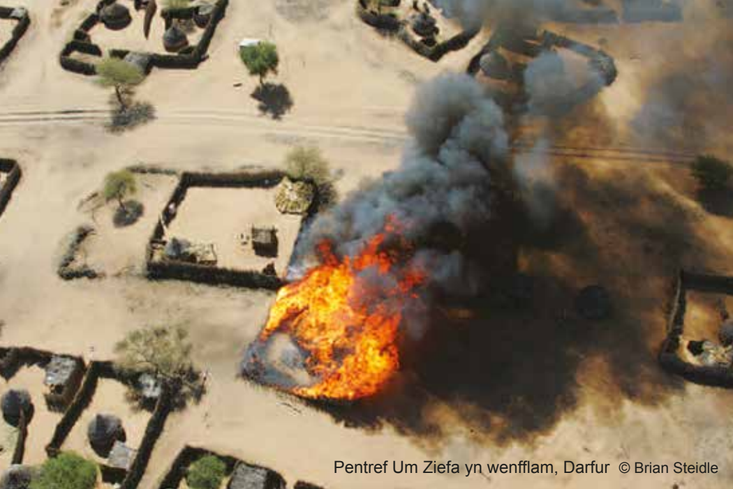
Pentref Um Ziefa yn wenfflam, Darfur © Brian Steidle