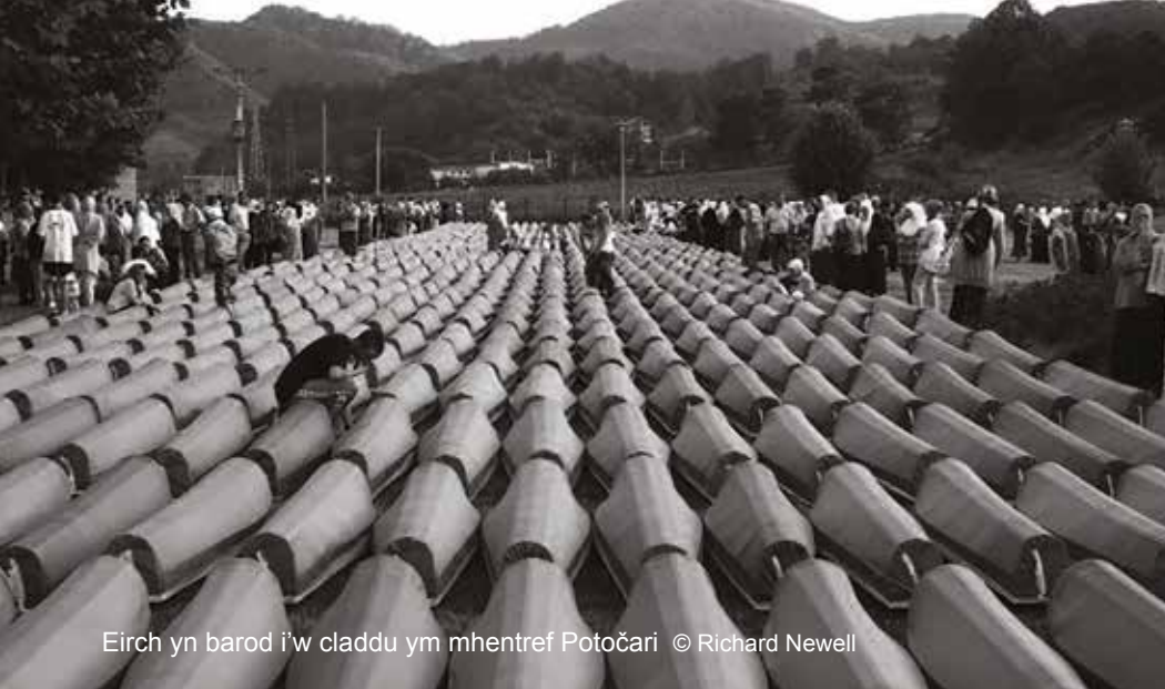
Eirch yn barod i'w claddu ym mhentref Potočari