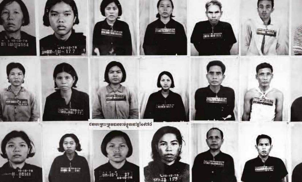
Lluniau carcharorion yn Amgueddfa Hil-laddiad Tuol Sleng, Cambodia